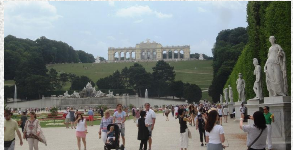
Am letzten Tag noch kurz nach Schönbrunn.....