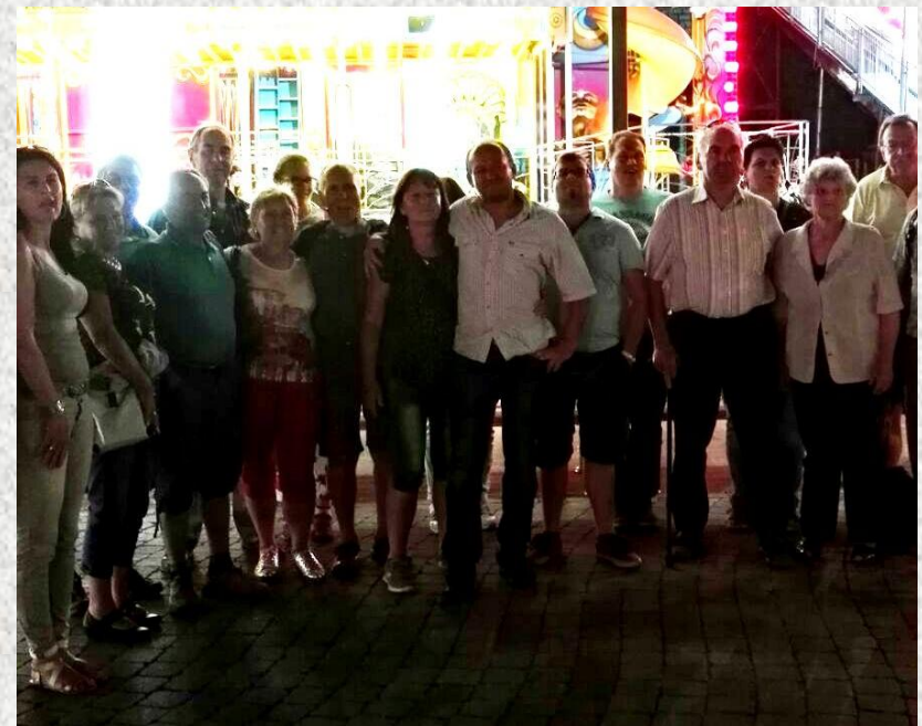
aber einmal muss man auch vom Prater wieder heim.....