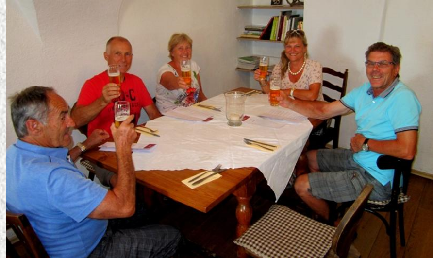
Mittagessen in Gumpolskirchen.....