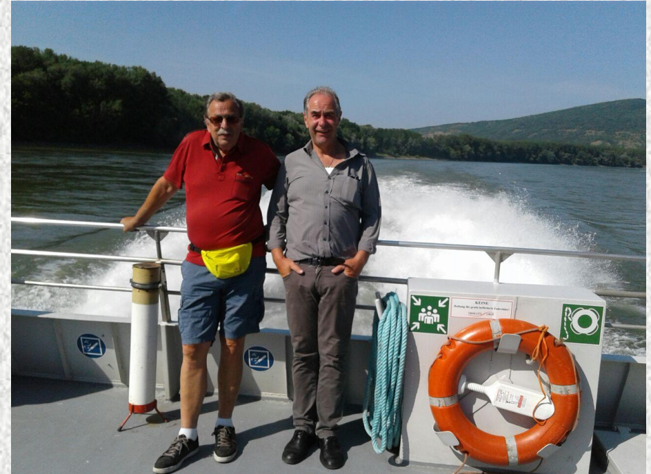
...am nächsten Tag geht's mit dem „Schnellboot“ nach Bratislava....