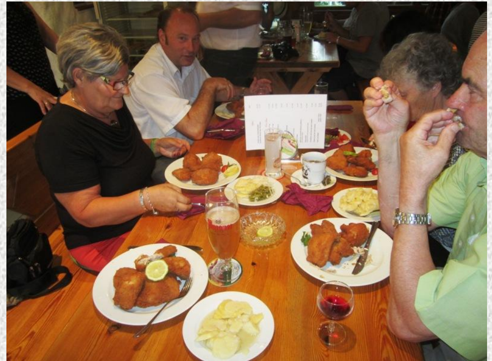
..... den Abschluss bildete ein „Backhendlschmaus“ in der Steiermark!