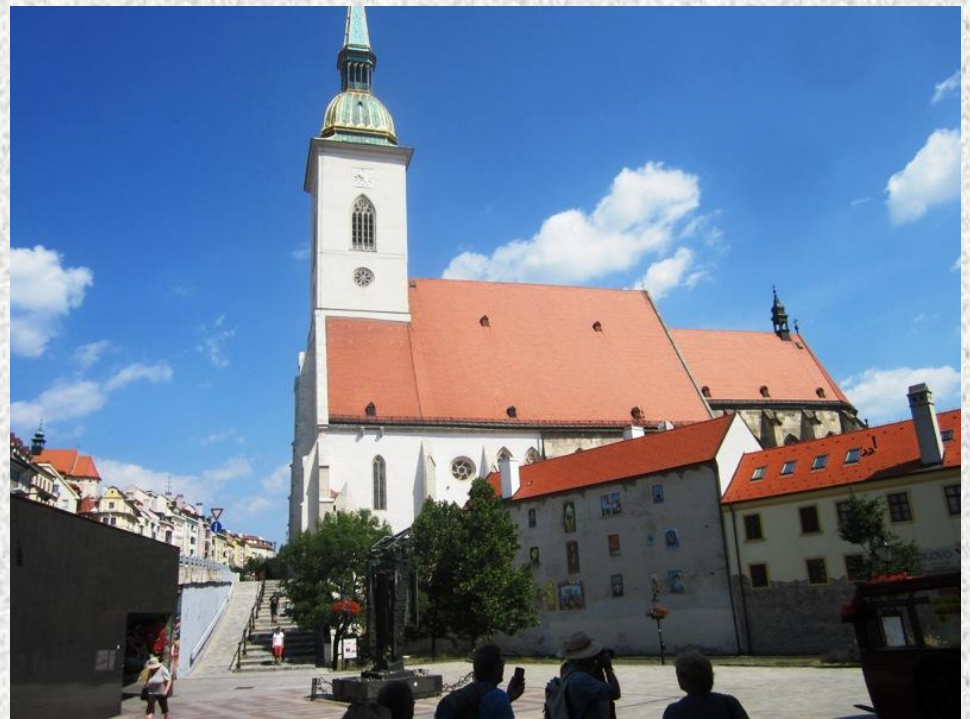
...dort erwartet uns schon eine Fremdenführerin und zeigte uns zahlreiche Sehenswürdigkeiten.....